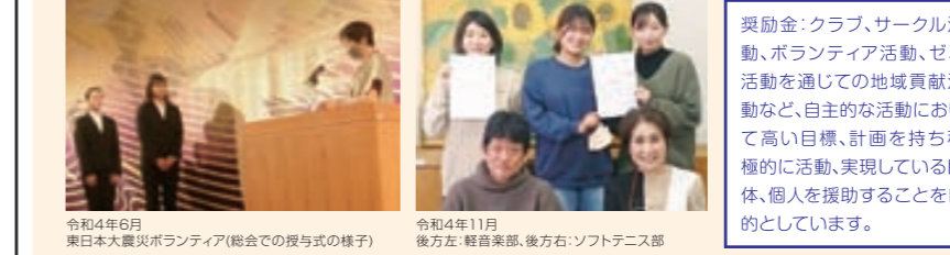
令和4年6月 東日本大震災ボランティア(総会での授与の様子) 令和4年11月 後方左:軽音楽部、後方右:ソフトテニス部

在学生支援の一環として、奨学金・奨励金授与を年に2回行っています。令和4年度は、奨学金を5名に、奨励金を「東日本大震災ボランティア」「軽音楽部」「ソフトテニス部」の3団体に授与しました。また、奨学金につきましては、長引くコロナ禍の影響等で奨学金を希望する学生が増えたため、臨時的奨学金給付も行いました。